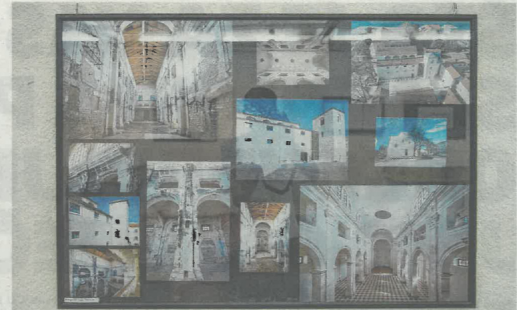
Prošlost kroz nekoliko fotografija

Nakon 2000. godine južni prostor bivšeg samostana se arheološki istražuje, uređuje i prenamjenjuje za Međunarodni centar za podvodnu arheologiju. Na dijelu obale ispod bastiona sve do kraja 20. stoljeća nije ništa izgrađeno. Taj dio grada ostao je manje-više osim parkovne arhitekture izoliran i zapušten sve do izgradnje Morskog orgulja i Pozdrava Suncu prenamjenjajući prostor palače sv. Nikole u obližnjem sklopu postao Edukativni prezentacijski centar za podvodnu arheologiju u okviru Međunarodnog centra za podvodnu arheologiju u Zadru, ta koji je svečano otvoren u travnju 2024. godine.