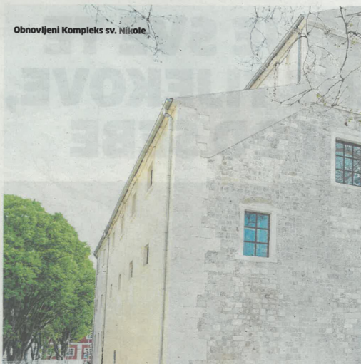
Obnovljeni Komplex sv. Nikole