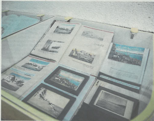
Izložba obuhvaća stoljetno postojanje