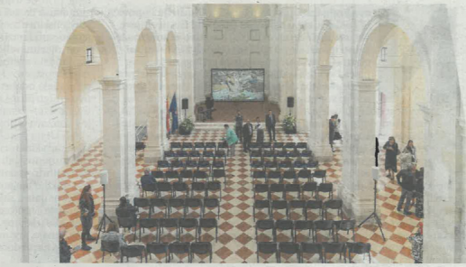
Prostor je i danas mjesto zanimljivih priča koje se isprepliću