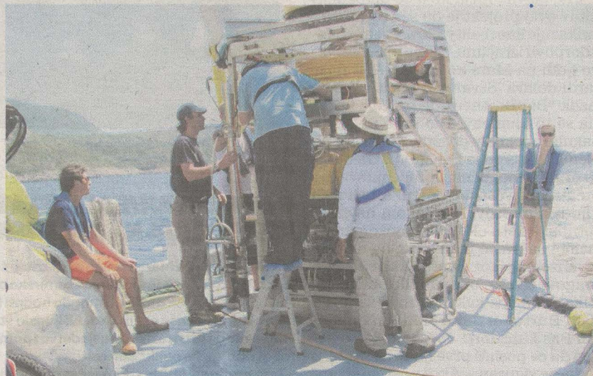
Podvodni robot, sonari i sva čuda moderne tehnike jednog od najsuvremenijih istraživačkih brodova pregledavali su dno na dubinama od 90 do 100 metara

Američka zaklada RPM s Floride istražuje Mediteran, a proteklih su godina već pretražili dno uz albansku i crnogorsku obalu. Značajan i vrijedan projekt provode pod okriljem Ministarstva kulture i Unesca