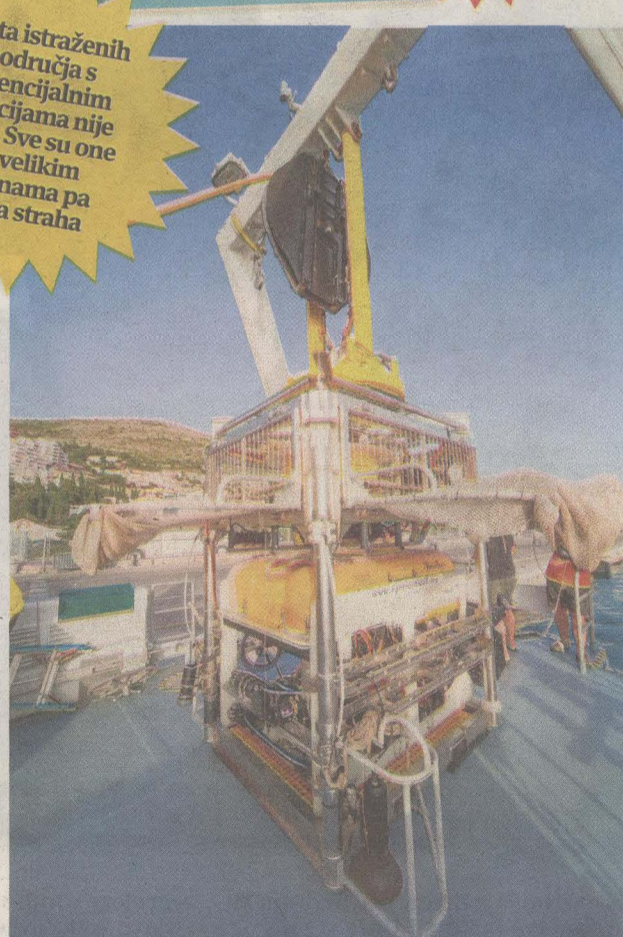
Robotom se upravlja s broda, a on zaranja u morske dubine, snima i uzima uzorke te obavlja iskopavanja

Ništa od toga nije bilo neočekivano niti je pokvarilo dojam. Nakon što je Hercules podigao sidro i napustio Jadrano, otkrića treba obraditi, očistiti, restaurirati i staviti u povijesni kontekst kako bismo dobili još jedan dio mozaika o potopljenoj baštini. Pronalascima su se oduševili i američki znanstvenici. Glavni dio troškova, koji iznose nemalih 25.000 dolara na dan, snose sami. Poručuju da će doći i dogodine. Naše je tek da ih ugostimo, osiguramo vez i gorivo.