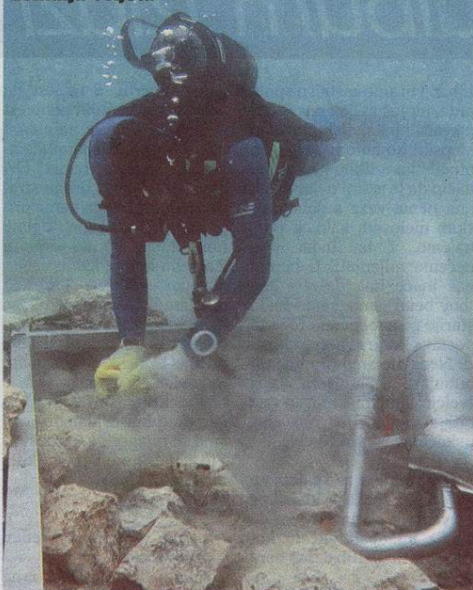
Prvi međunarodni kongres podmorske arheologije održan je u veljači 1999. godine u Sassnitzu

Od 29. rujna do 2. listopada u Zadar dolazi oko 300 stručnjaka za podvodnu arheologiju iz svih zemalja svijeta